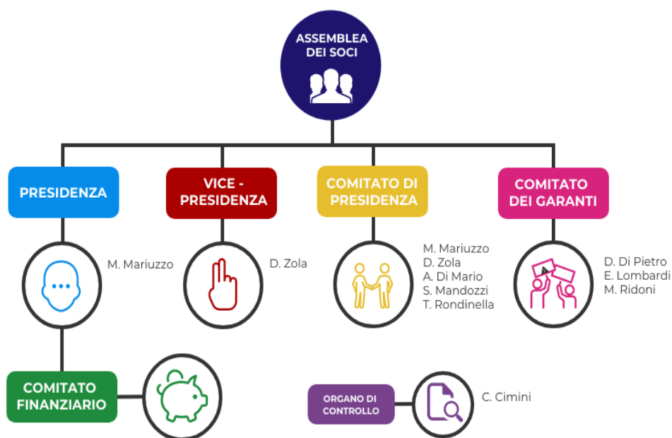
Figura 1. Organigramma 2023 di Lunaria - Assetto istituzionale

Le diverse figure hanno partecipato a specifici corsi di formazione. L'intero staff è stato inoltre formato sui rischi presenti sul luogo di lavoro, ed è stato redatto il documento di valutazione dei rischi, il DVR. Infine, in ottemperanza alla normativa europea sulla protezione dei dati personali (GDPR-General Data Protection Regulation), Lunaria ha nominato un data protection officer .