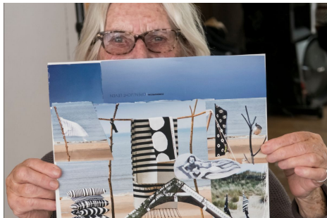
Foto: Caro Bonink, Lunaria, queraum (autunno / inverno 2019 / 2020)

Se sei interessato / interessata a un aggiornamento regolare sulle attività e sui risultati del progetto, nonché su storie e iniziative stimolanti, dai un'occhiata al sito del progetto: www.invisible-talents.eu